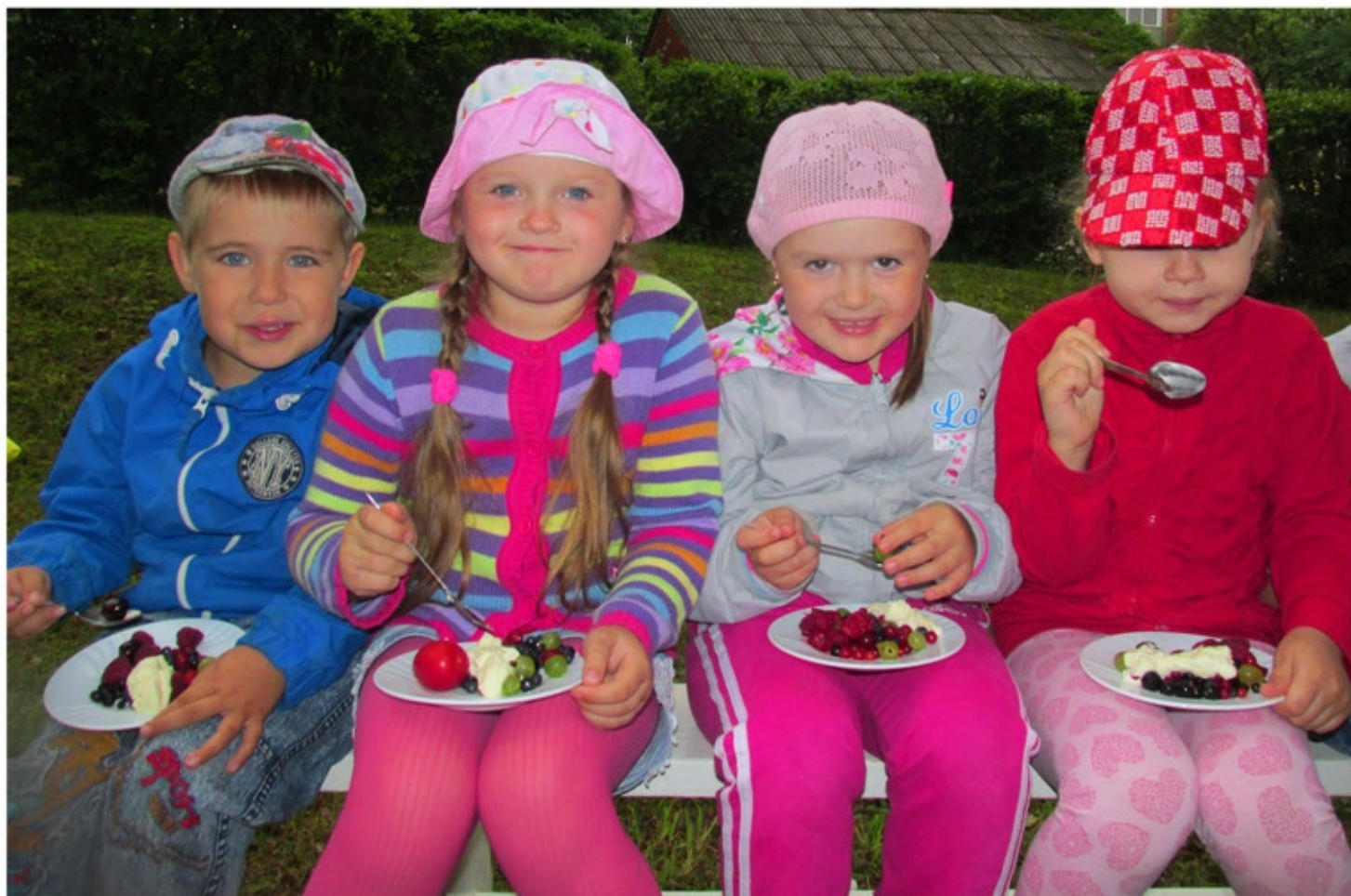
Našņošanās ar ogām un putukrējumu.