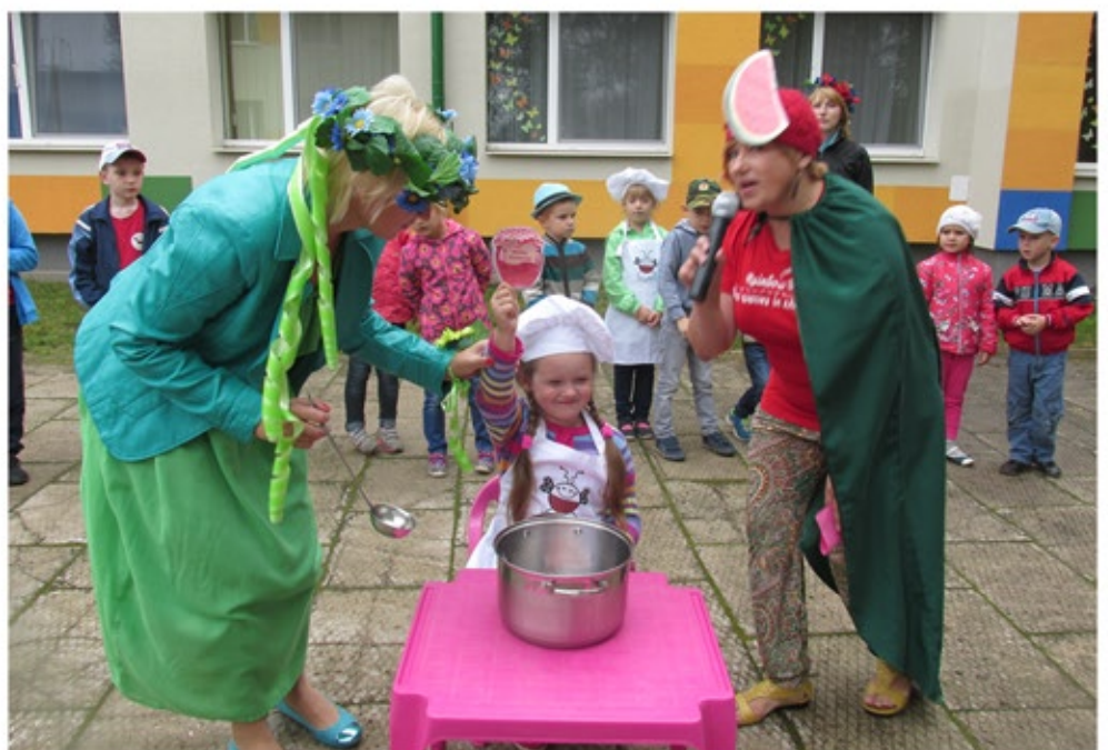
Bērni “vāra” ogu ievārījumu.

Arbūzs: Sveicināti, draugi! Beidzot jūs esat mani atraduši. Aicinu jūs visus aplī, vārīsim brīnumkatliņā ievārījumu.