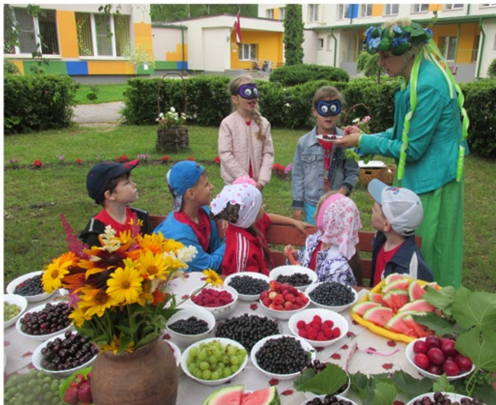
Pirmskolēni aklajā degustācijā min ogu nosaukumus.

Visiem bērniem garšo tās! (Bērniem aizsien acis, dod nogaršot ogas, bērni min to nosaukumus.)