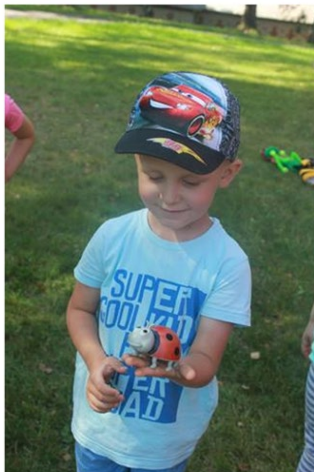
Zem zaļām lapiņām un puķītēm ir paslēpušies kukaiņi – nelielas rotaļlietas. Bērni meklē viņus, nosauc: muša, sienāzis, zirneklis, sparīte u.c.