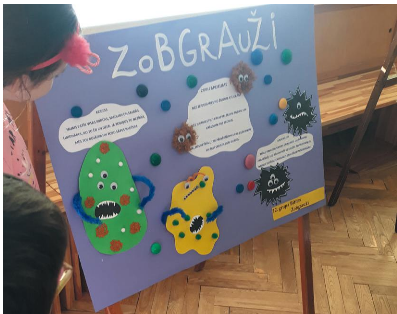
Sagatavošanas grupas bērni iepazīst zobgraužus un, ja nerūpējas par zobiņiem, to sliktos darbus.