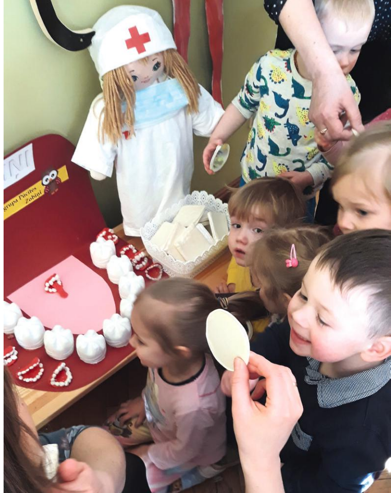
Pirmās jaunākās grupas bērni ar skolotāju iepazīst zobus, mēli un pasmaida sev un draugiem.