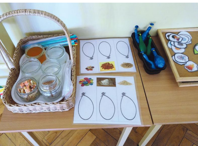
Grupas „Zaķēni” sagatavotais sajūtu centrs: garša, smarža, tauste.