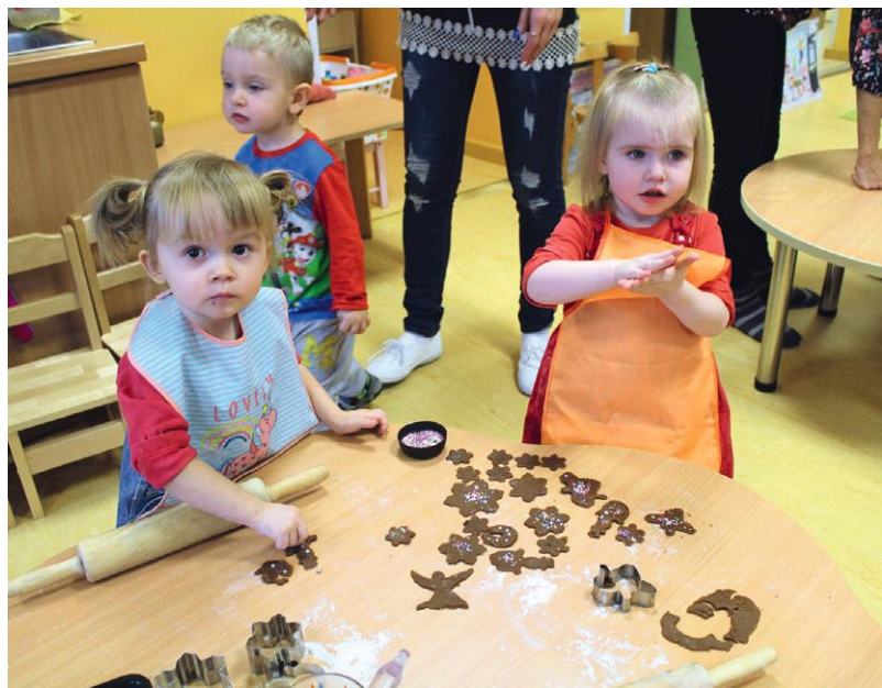
Mazie divgadnieki cep.

me rūpēties par draugu, grupu, kolektīvu, ciemiņiem. Bērni gatavo ciestastu gan savām ballītēm, gan vecākiem, gaidot viņus ciemos. Papildus tiek apgūta arī galda klāšanas kultūra – bērniem ir iespēja domāt, fantazēt, spriest un kopīgi vienoties par vienotu noformējumu. Atšķirībā no iepriekšējās pieejas viss notiek dabiski, reālajā situācijā, nav laika ierobežojumu (20–30 minūšu nodarbība). Bērni visas dienas garumā gatavojas vakaram: gan noformējot telpas, gan klājot galdu ar pašgatavotajiem gardumiem.