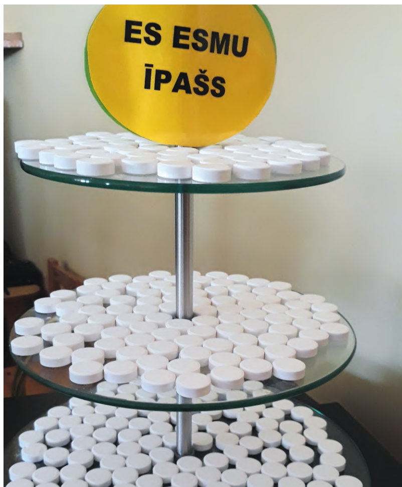
Katram bērnam iestādes medmāsa Ilze bija sarūpējusi veselīgu pārsteigumu – vitamīnu C.