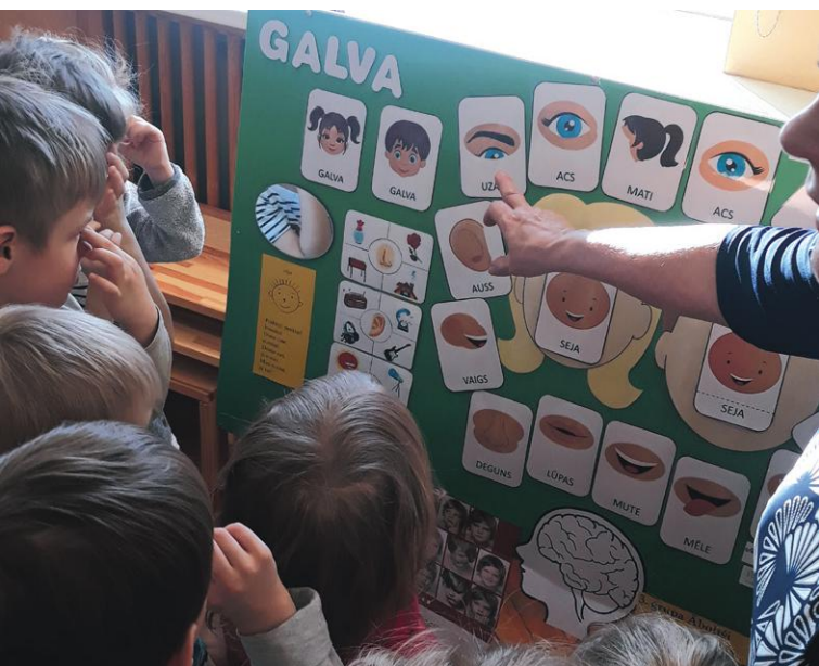
Vidējā vecuma bērni kopā ar skolotāju iepazīst galvu (seju) un noskaidro, kas atrodas uz galvas.