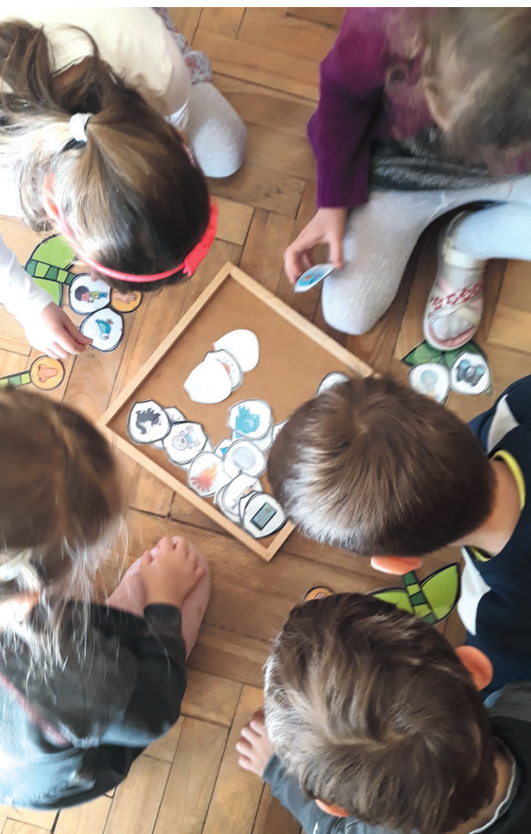
Sagatavošanas grupas bērni aktīvi darbojas ar didaktisko materiālu „Ko es redzu, dzirdu, sajūtu”.