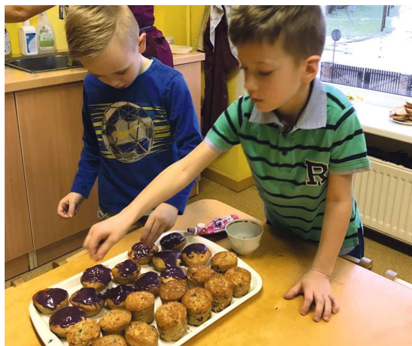
Arī lielie bērni cep – visu, ko vien var!

krīt, nobraž ceļgalus un gūst pieredzi, kā izvairīties no līdzīgām situācijām.