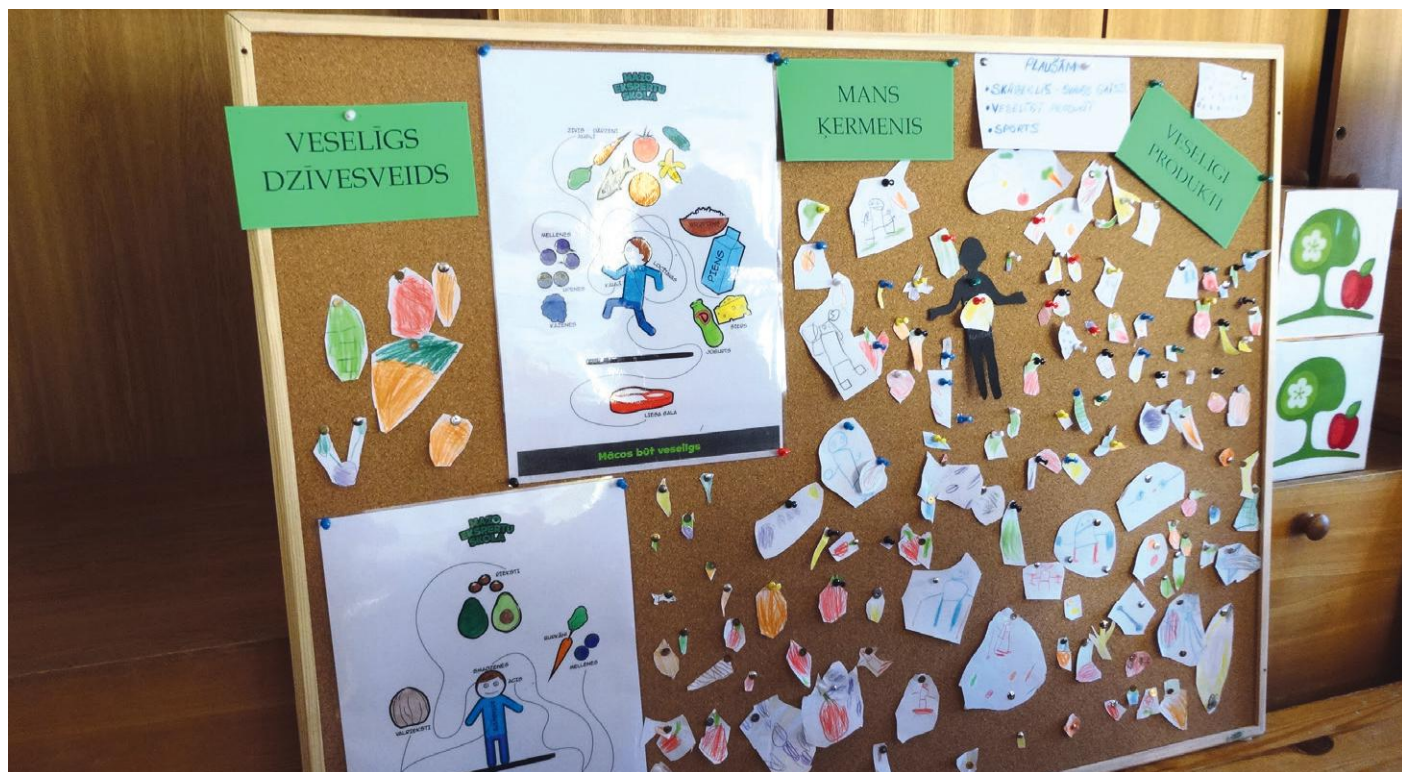
Vecākās grupas bērnu sagatavotais materiāls „Veselīgs dzīvesveids”: lai ķermenis justos labi.