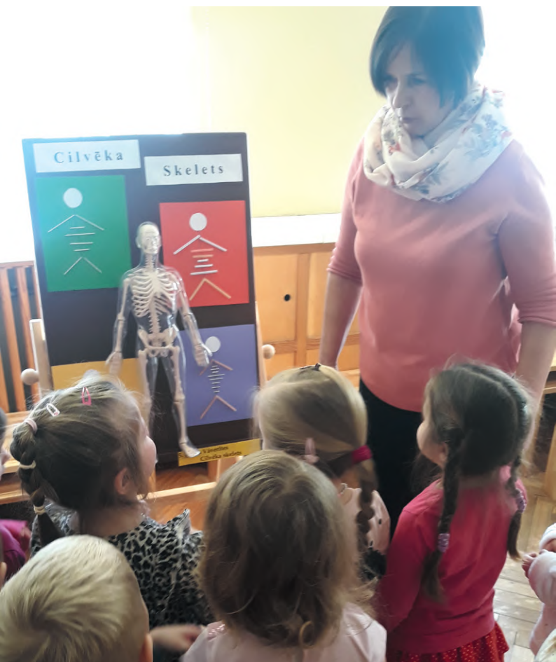
3–4 gadus vecie bērni iepazīst cilvēka skeletu un sarunā ar skolotāju noskaidro, kur mums katram ir kauli un kas būtu, ja mums kaulu nebūtu.