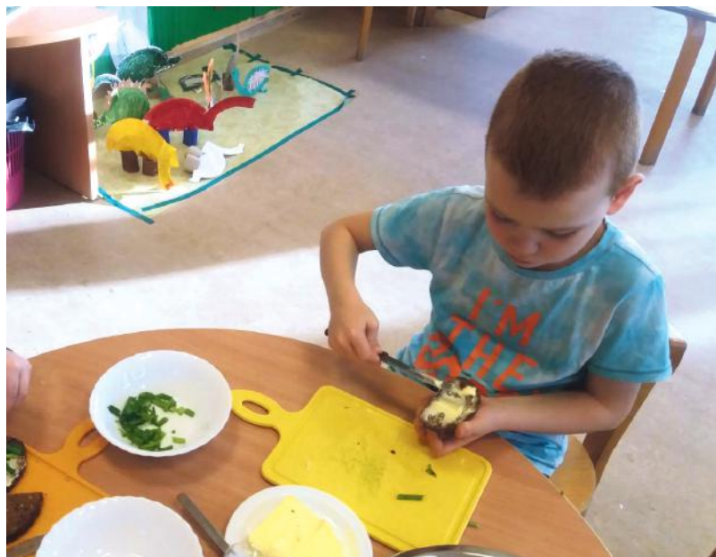
Bērniem ļoti patīk gatavot maizītes un ar tām cienāt draugus. Mazie tikai mācās griezt sīpollokus un darboties ar nazi, savukārt lielie patstāvīgi paveic visu – gan nogriež pašu audzētos lokus, gan sasmalcina tos, gan apsmērē maizi.