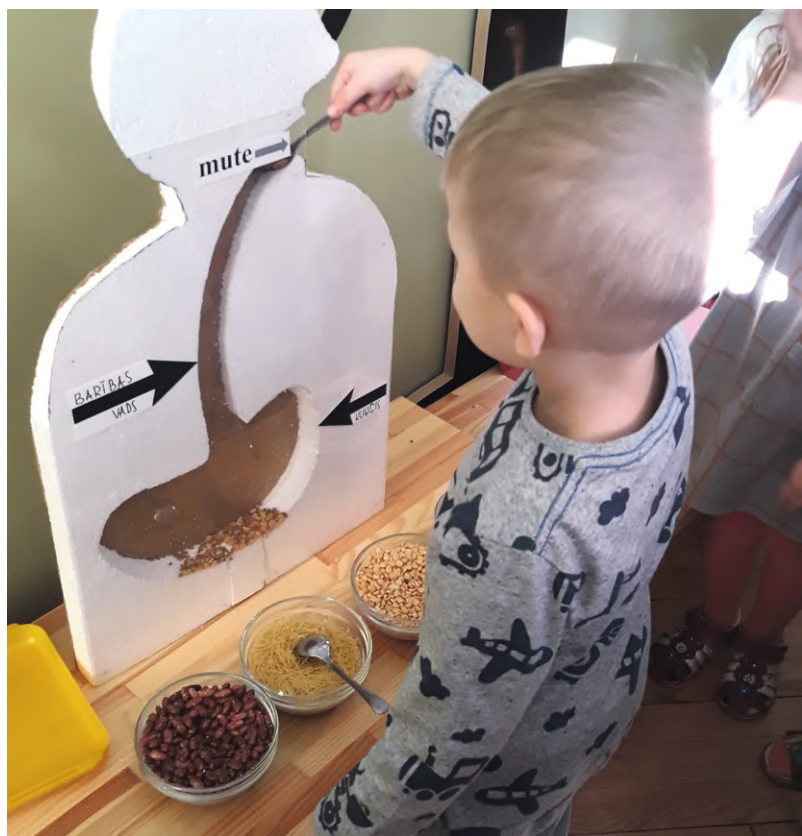
Četrus gadus vecs zēns „baro” cilvēka maketu, iepazīstot, kā ēdiens nonāk kuņģī.