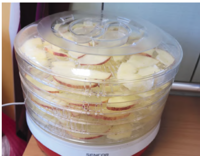
Kad ābolu ir tik daudz, ka nav, kur likt, gan žāvējam tos, gan cepam ābolu pīrādziņus.