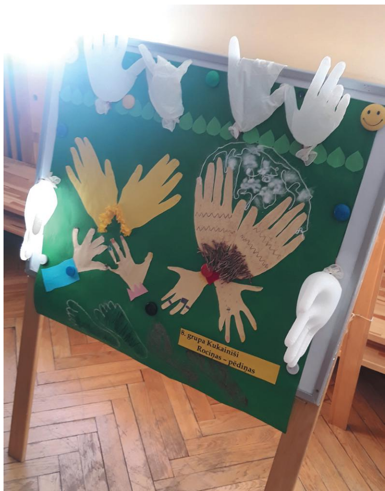
Iepazīstot rokas un kājas, tiek noskaidrots būtiskākais par personisko higiēnu.