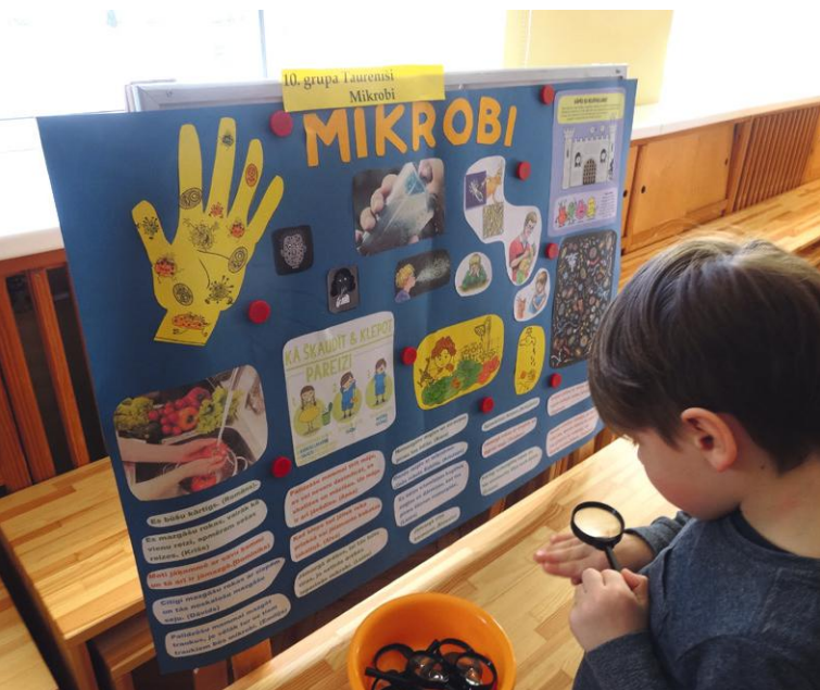
Vidējā vecuma bērni pēta savu roku un nagu tīrību, iepazīst mikrobus un to īpašības.