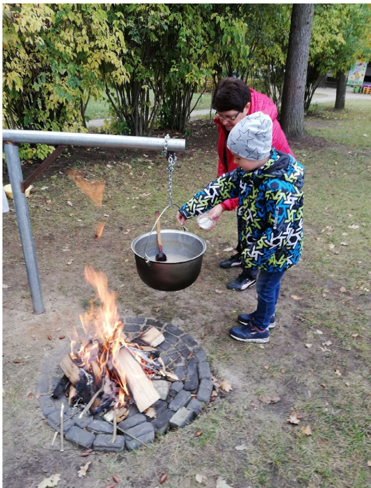
Bērni auklītei padod nepieciešamās sastāvdaļas, tikmēr skaita tautdziesmas, lai putra sanāktu gardāka un vārīšana jautrāka.

prosa, griķi), uzdevums ir aizskriet līdz konusam un atrast pēc taustes otru maisiņu ar tādu pašu saturu.