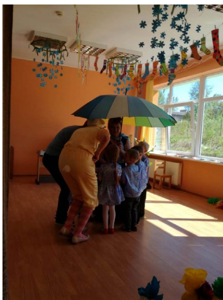
Audzinātāja dejo ar lietussargu pa vidu, bērni stāv izvietojušies aplī.