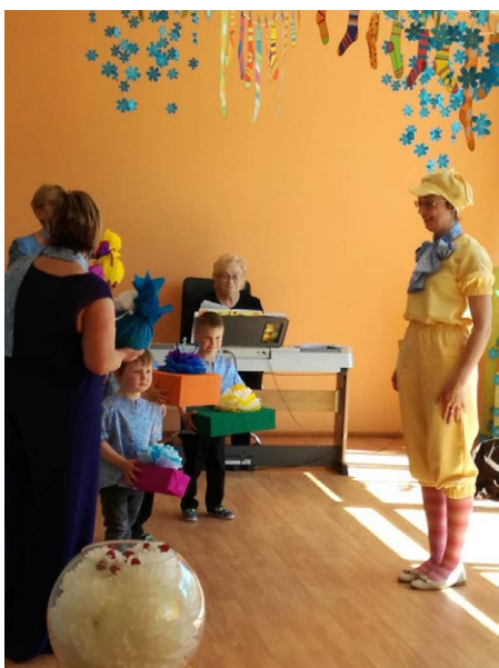
Bērni apsveic zaķi, katrs atdodams savu dāvanu, ko zaķis izvieto aizkara priekšā.