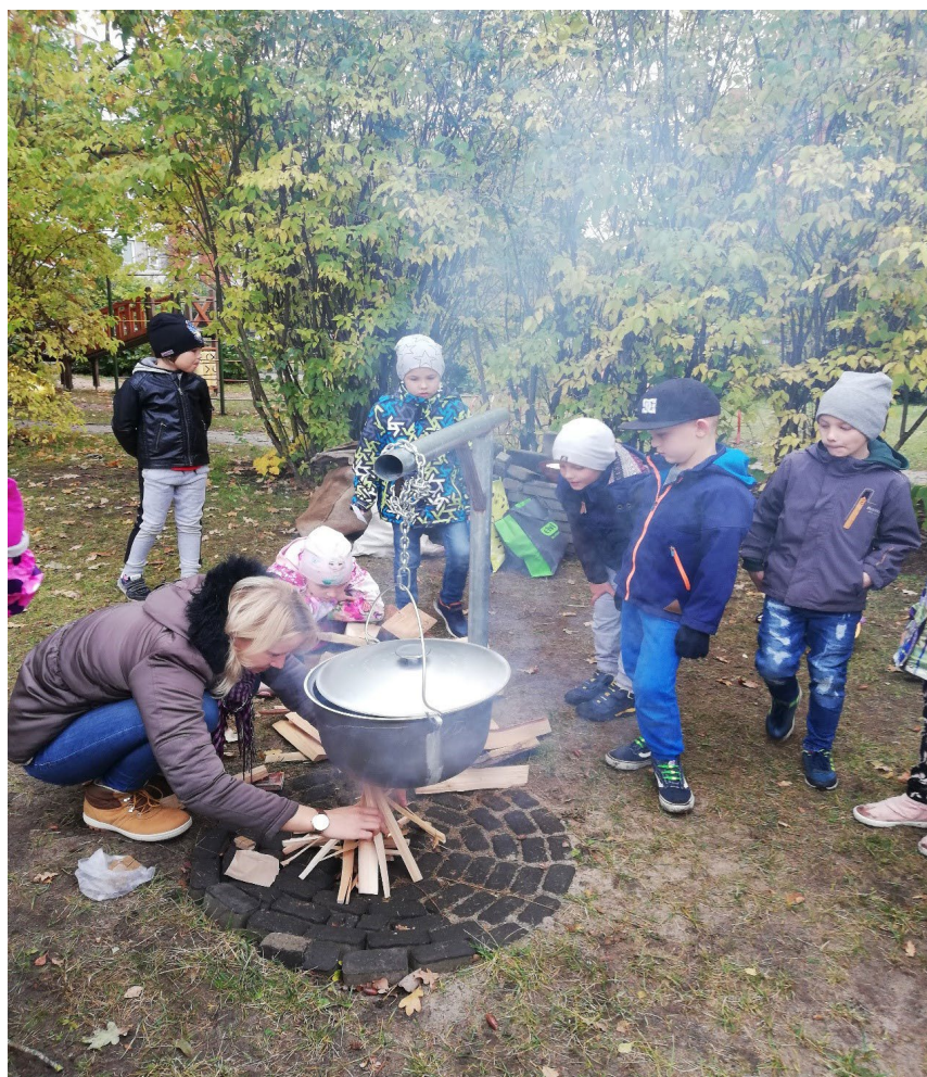
Daži bērni kopā ar skolotāju sakārto ugunskurā skaliņus, lai izdotos iekurt ugunsкуру, kamēr skolotāja iekur ugunsкуру, vēlreiz kopīgi tiek atkārtoti uzvedības noteikumi pie ugunsкура.