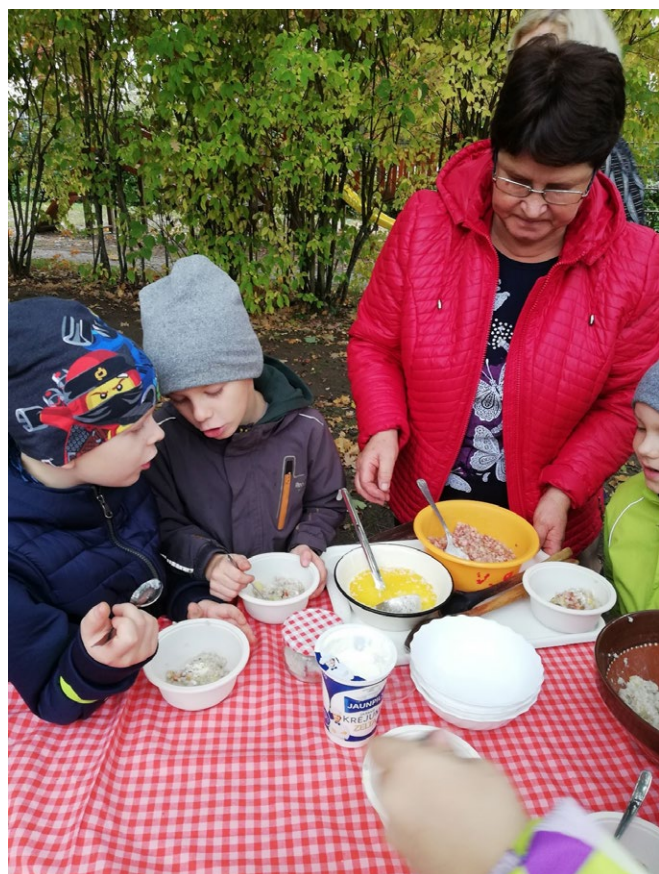
Bērni dodas pie lielā katla, kur auklīte ieliek putru, katrs bērns sev ielej mērcīti vai pieliek krējumu.