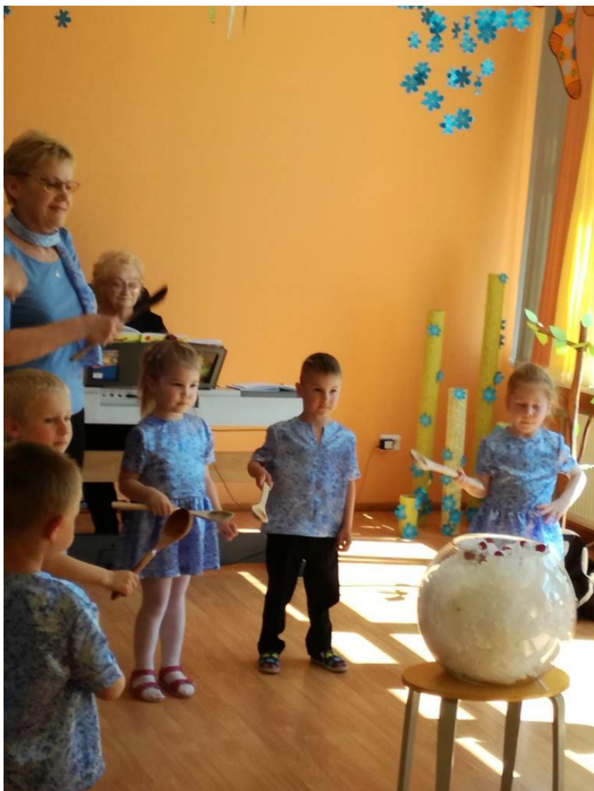
Bērni stāv aplī, pa vidu galdiņš ar trauku, kas piepildīts ar baltiem kreppapīra pušķiem, pa virsu tiem – sarkanās zemenītes. Bērniem rokās koka karotes.

Mīlie draugi, man šķiet, ka mēs esam atraduši vislielākās bagātības, kas vien mums var piederēt! Tie esiet jūs, mūsu ģimenes.